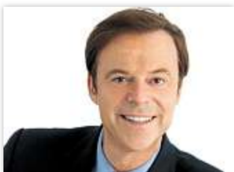
Christoph Mörgeli 1960, Prof. Dr. phil., Historiker