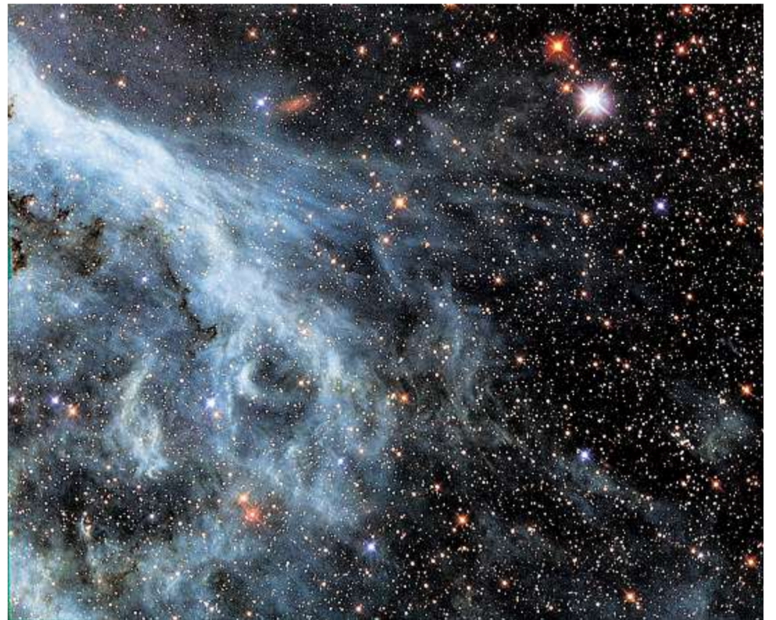
Der Carinanebel ist ein riesiges Sternentstehungsgebiet und etwa 8000 Lichtjahre entfernt.